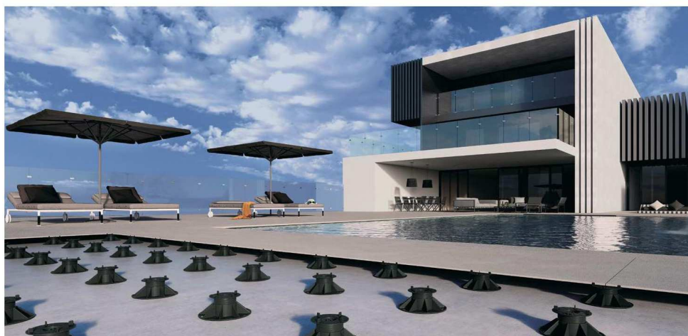
PP Level Fix