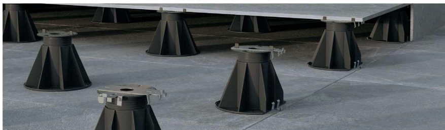
Clip in acciaio PCC/01 e PCC/02

Tra gli accessori per la posa dei pavimenti sopraelevati da esterno, oltre alla chiave di regolazione dall'alto, sono presenti un tappetino in gomma, dischi livellanti e un sistema completo per la realizzazione di gradini e battute verticali. PCC/01, PCC/04 e PCC/02 sono delle clip in acciaio inox da applicare sulla testa e alla base dei supporti perimetrali e angolari: tra le due clip va posizionata la piastrella di tamponamento in modo da creare un gradino esteticamente perfetto. Un risultato che si ottiene anche con le clip PCC/03 e PCC/05 per la posa a ridosso dei muri verticali, in modo da mantenere sempre la stessa distanza tra piastrella e muro.